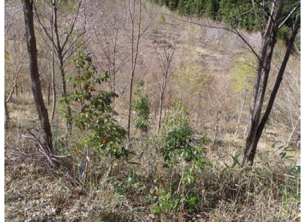
遊学の森を歩くと、植樹したヤマザクラがあちこちで咲いています。ひとりお花見です