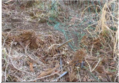
本当に被害が多くて困ったものです