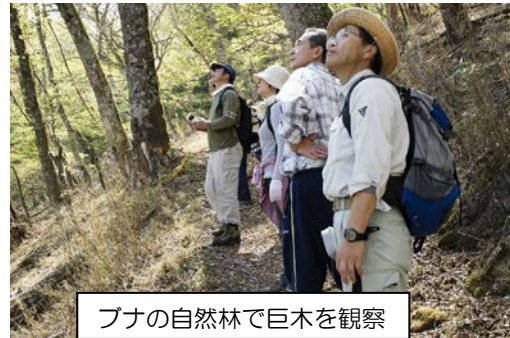
ブナの自然林で巨木を観察