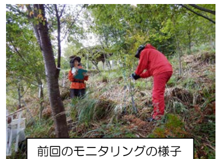
前回のモニタリングの様子

遊学の森の森づくり活動は、今年度で15年目です。植樹をして育林を現在も続けていますが、当初と比べると、森の様子が大きく変わっています。5月20日には、植樹をした後、草刈りや除伐といった森づくり作業を行い、その結果、育った木はどのくらい残っているのか。を調べる作業（＝モニタリング）を行います。森づくりボランティア29団体の皆さんをはじめ、森づくりに関わってくださった皆さんの活動の成果を、具体的に数字で見ることができます。また、樹木の勉強にもなりますので、興味のある方はぜひご参加ください。