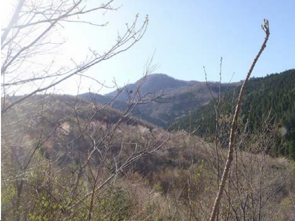
4月の高丸山です。今年の春は、気温が驚くほど高く慌ただしい春となりました