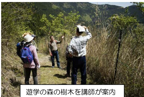
遊学の森の樹木を講師が案内

ゴールデンウィークにあわせて、遊学の森とブナの自然林を樹木医さんに学びながら歩く、「春の遊学の森散策」という行事を行いました。今年は例年に比べて暖かい日が続いたため、遊学の森、自然林ともに春の花から新緑を見ることができました。午前中は駐車場から、遊学の森へ向かい、道すがら出てくる木々について説明を講師から、それについての質問などが相次ぎました。遊学の森のあずまやで昼食、休憩を取ったあと、午後からはブナの自然林での勉強です。人が作った森（遊学の森）と、自然の営みの中でできあがってきた森との違いなどを学びました。