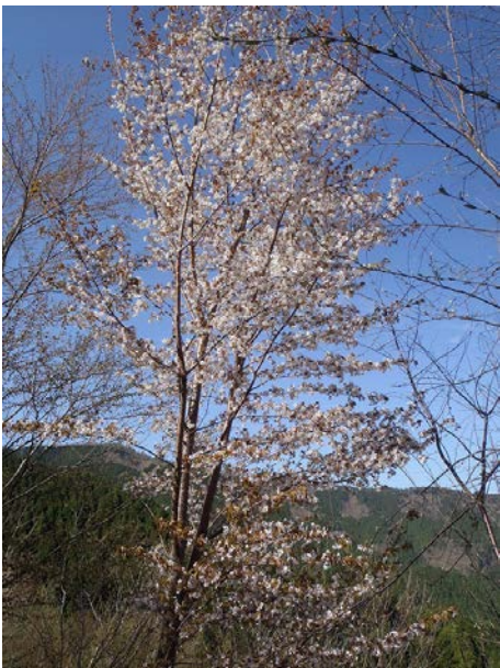
ぎゅーんと大きく育ったヤマザクラ。遊学の森で、お弁当を広げて花見もできます。今年も見事でした