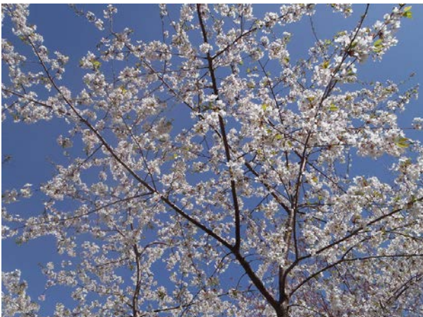
あすまや前のヤマザクラ。毎年一番目立っているのではないのでしょうか。とても賑やかです