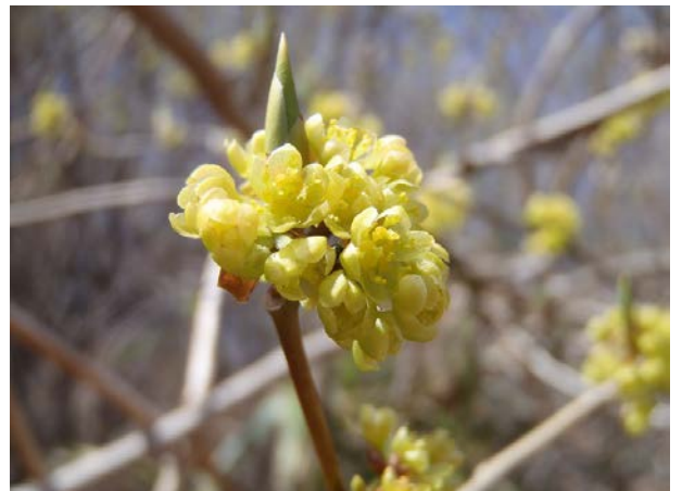
シロモジの花も咲いていました。春の花らしく、ピッカリと輝く黄色の花です。