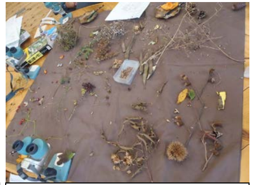
たくさん取った実を顕微鏡で見たり、分解したり…20個くらいはありました。