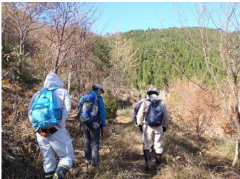
タネはないか〜と、道の両脇の木を見ながら歩きます。

2回目は12月10日に行いますが、千年の森の森づくりを行う際に使った、マルチキャビティコンテナでの苗を育てる体験も計画しています。ぜひご参加ください。