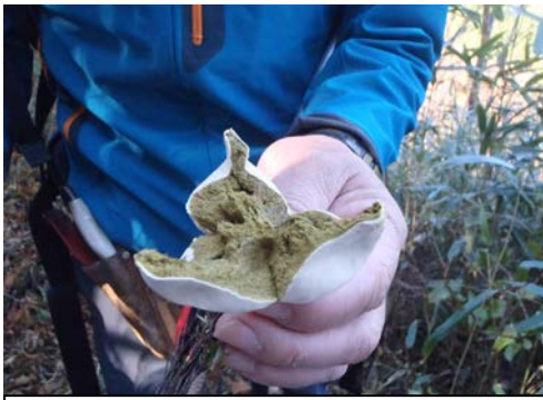
これ、キノコでほこりが出るやつ〜。といい、中を割ってみました。抹茶みたい…。