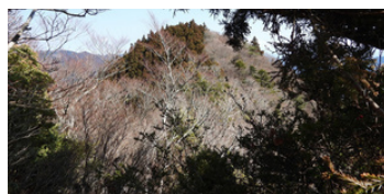
西峰からの眺めた山頂