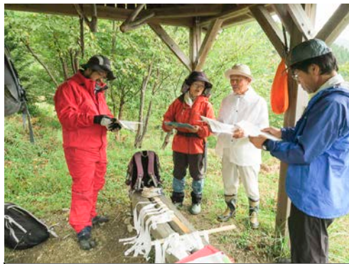
3～5人程度が1班になって動きます