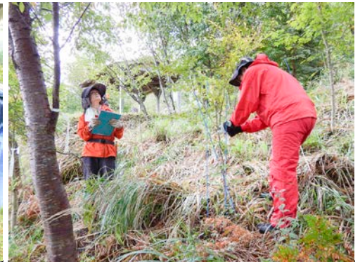
役割分担して木の本数を数えます