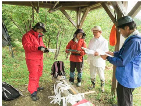
3～5人程度が1班になって動きます